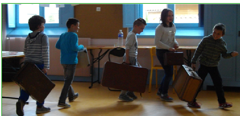
L'atelier d'improvisation théâtrale. Les enfants ont adoré !