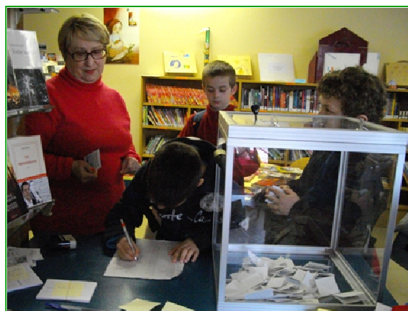
Le vote du prix littéraire. On sent tout le sérieux de l'enjeu !