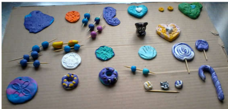
Œuvres réalisées par les enfants avec objets de récupération et pâte fimo pour porte-clés et bijoux

A la rentrée de septembre 2018, nous avons la possibilité de revenir à une semaine de 4 jours. Nous réfléchissons conjointement avec Chirassimont mais lors du dernier conseil, l'assemblée s'est positionnée favorablement au retour à la semaine à 4 jours d'école.